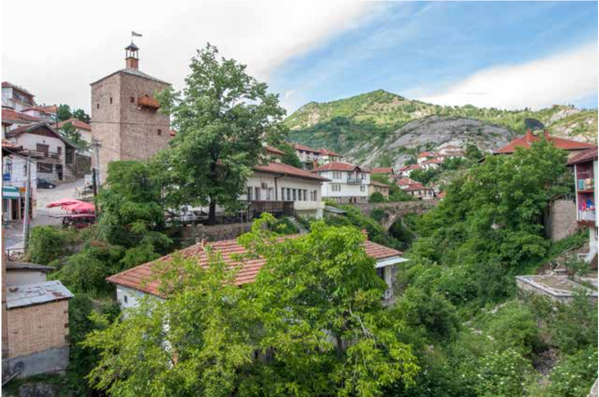
Сл. 3. Поглед кон Саат-кулата во Кратово