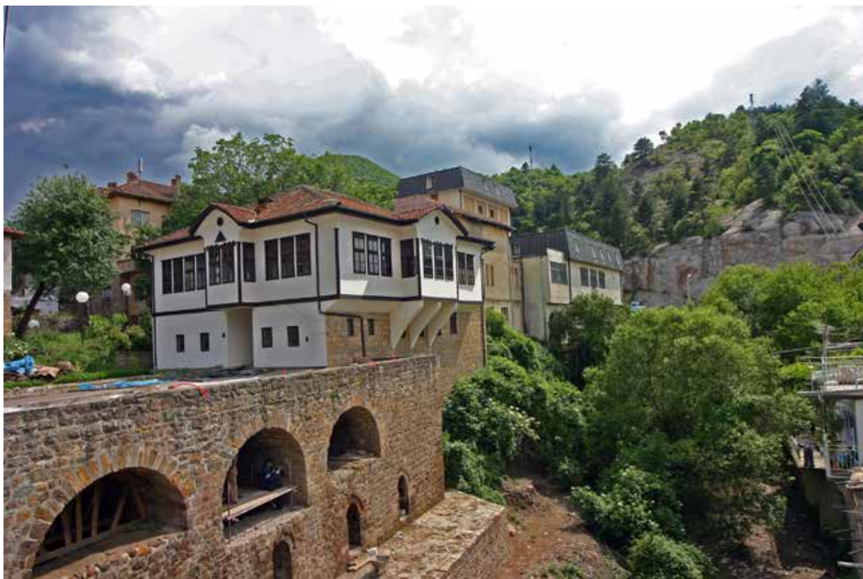
Сл. 4. Поглед кон Музејот во Кратово

што неговите единаесет зачувани дела, пред сè, четвороевангелијата, чинат единствена целина во поствизантиската илуминација и ракописна книга од времето на османлискиот период 14 .