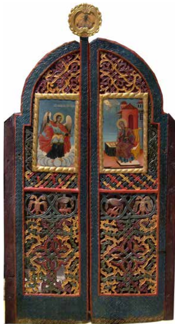
Сл. 5. Царските двери од црквата Св. Никола во Кратово

„Св. Архангел Михаил“ и додава дека во Кратово во текот на XVI и XVII век постоела католичка црква на Богородица, како и црква на св. Никола Чудотворец 22 .