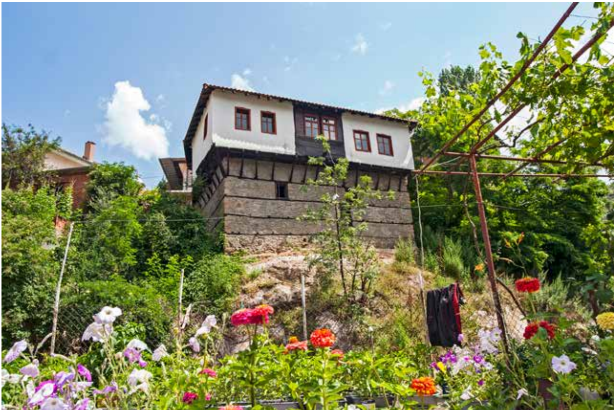
Сл. 6. Староградска архитектура во Кратово

Ова несомнено укажува дека во Кратово морало да има повеќе сакрални црковни објекти, при кои сослужувал овој, навистина броен свештенички сталеж 23 .