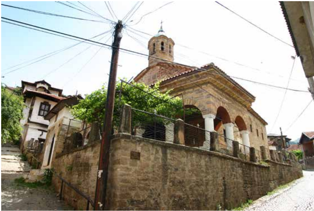
Сл. 2. Црквата Св. Јован Претеча во Кратово

тово, во кој е зачуван и записот за црковно одбележување со службата за денот на кратовскиот новомаченик Св. Ѓорѓи Нови 2 . Во старата збирка на Белградската народна библиотека (бр. 350) се чувало и едно четвороевангелие од XIV–XV век, кое според еден подоцнежен запис од втората половина на XVI век му припаѓало на кратовскиот кнез Андрија Бојчиќ (Си тетроевангел приложи кнез Кратовски Андрија) 3 .