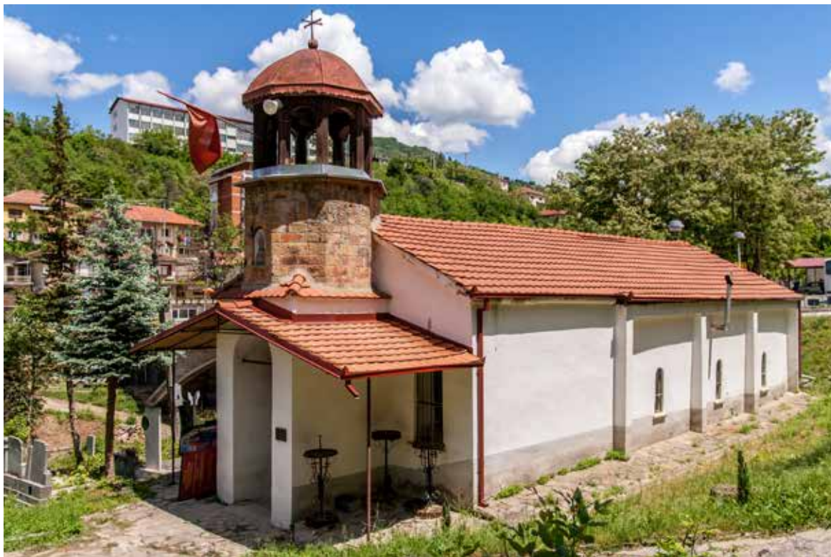
Сл. 6. Црквата Св. Ѓорѓи Кратовски во Кратово

епископија и обновената Пеќска патријаршија во периодот на XVI и XVII век 26 .