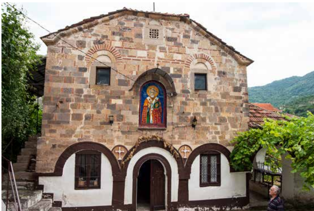
Сл. 2. Црквата Св. Микола во Кратово

во преписот на овој значаен ракопис, најважниот правен кодекс од доцновизантискиот период, составен од Матија Властар во 1335 година, е поговорот или Послесловието каде што Димитар дава повеќе биографски податоци за себе и за своето семејство, но, исто така, и за војните и за црковните состојби за времето во кое живеел, проследени со еден учен теолошко-морализаторски трактат 8 . Овој важен ракопис бил нарачан од охридскиот архиепископ Доротеј, кој во првата половина на 1466 година, при својата архијерејска визитација, обиколувајќи ги градовите во североисточниот дел од дијецата, го посетил и Кратово, каде што се сретнал со првенците меѓу болјарите, свештениците и монасите, а одржал и беседа за утврдување на христијанската вера и нејзината сила во тие тешки времиња. Архиепископот Доротеј имал средба и со дијакот Димитар, од кого, како што веќе рековме, го нарачал преписот на Номоканонот. Во духот на средновековната традиција, архиепископот Доротеј прифатил, по завршената работа, да ги спомнува Димитар, неговата фамилија и неговите предци за време на неделните литургии 9 . Интересно е да